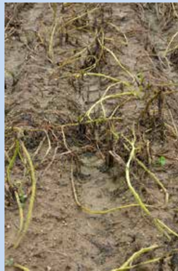
4. OPVZ – povolené biologické přípravky 2