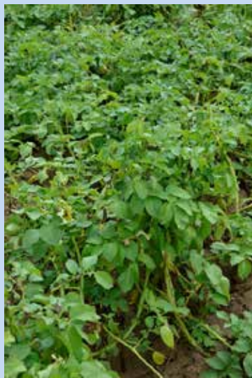
2. standardní ošetření