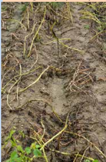
9. OPVZ – testované biologické přípravky 2