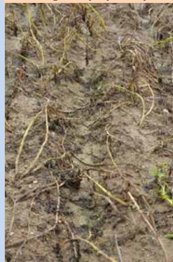
8. OPVZ – testované biologické přípravky 1