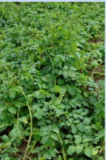
6. OPVZ- povolené chemické přípravky 2