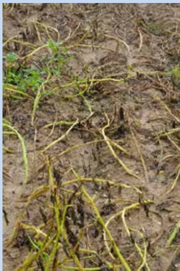
1. Neošetřená kontrola