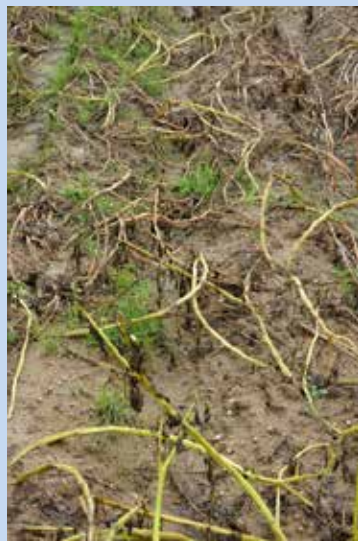
3. OPVZ – povolené biologické přípravky 1