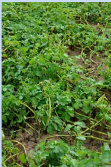
7. OPVZ- povolené chemické přípravky 3