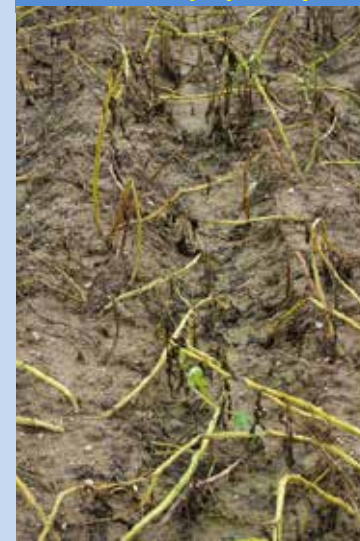
10. OPVZ – testované biologické přípravky 3